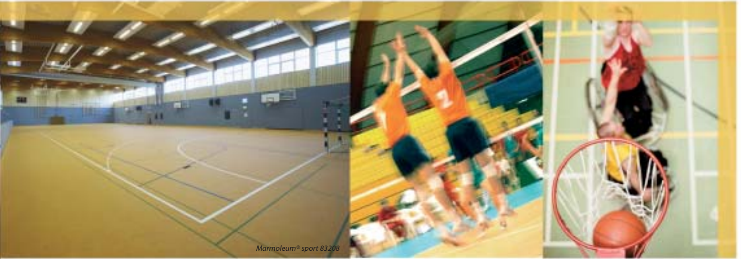
Marmoleum® sport 83208