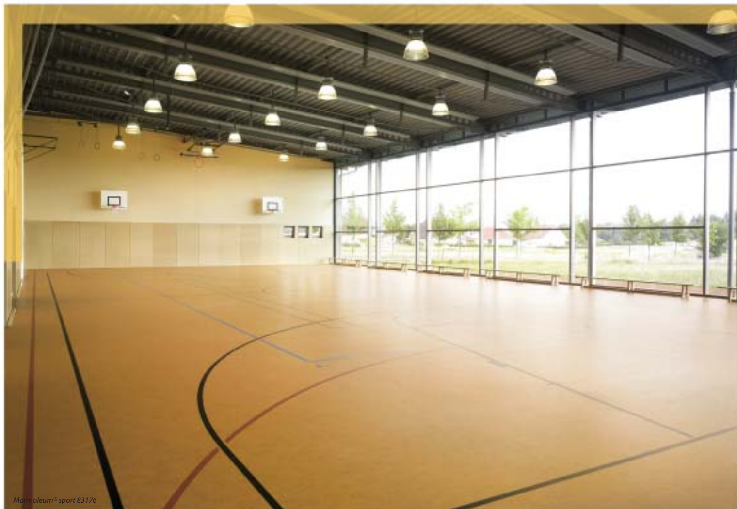
Marmoleum® sport 83176

Pro použití v oblasti sportu a sportovních podlah Forbo speciálně vyvinulo podlahovinu Marmoleum® sport. Je to jediné linoleum pro sportovní podlahu vyráběné v tloušťce 3,2 mm (některé barvy jsou také dostupné v 4,0 mm). Marmoleum® sport představuje velmi zajímavý poměr mezi cenou a kvalitou v porovnání s ostatními sportovními podlahami, zejména co se týče dlouhodobé životnosti podlahy i odolnosti vůči vysokému zatížení.