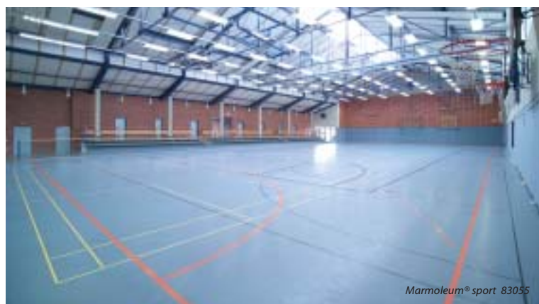
Marmoleum® sport 83055

Marmoleum® sport splňuje poslední evropské standardy pro sportovní podlahy EN 14904 a německé normy DIN V 18032-2.