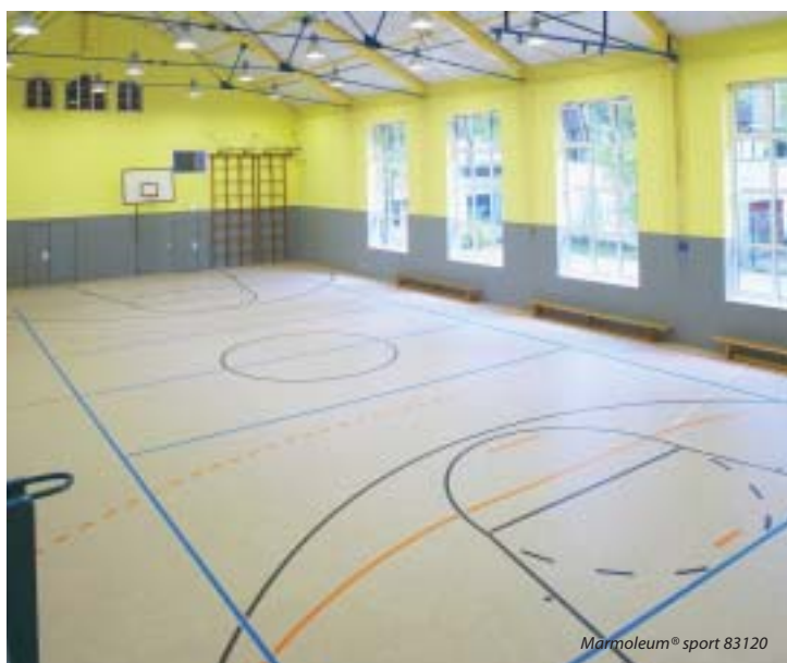
Marmoleum® sport 83120